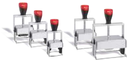
DATOWNIK SZKIELETOWY EXPERT LINE 3100 24 x 41 mm